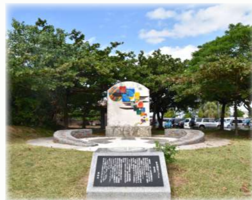
波の上ビーチと駐車場の間にあります

第二次世界大戦後期の1994年10月10日、十・十空襲がおこり南西諸島の広い範囲がアメリカにより空襲で被害をうけました。那覇市は市街地の大半が焼失し、街は壊滅しました。沖縄戦は、日本で唯一住民を巻き込んだ地上戦となり、戦没者は、沖縄全体では23万人余、那覇市民では2万8千人余の尊い人命が失われました。那覇市は、戦後50年の節目に、那覇市連合遺族会の提案に基づいて、戦没者の恒久平和への強い決意を世界の人々に伝えるため、那覇市平和宣言を行いました。そして、恒久平和のモニュメントとして1996年に「なぐやけの碑」が波の上ビーチ近くの旭ヶ丘公園内に建てられました。「なぐやけ」とは、「穏やか」「和やか」という沖縄の古語で、いつまでも平和でありますようにとの祈りが込められて名づけられました。