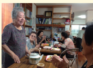
「いちご食堂」の様子 (若狭1丁目自治会事務所)

若狭1丁目自治会が地域の民生委員の協力のもと取り組んでいる「いちご食堂」をご紹介します! 今年の3月から毎月第3木曜日に自治会事務所で行われており、1人150円(イチゴ)を支払いみんなでユンタクしながら食事をする取り組みです。1丁目地域はご年配が多く、高齢者の「孤食」をなくしたいとの想いからはじまりました。提供される食事は毎回メニューを変え旬の食材や野菜を沢山使用するなどの配慮も欠かしません。毎回顔を合わせることで健康状態を把握したり自然と互いを思いやるようになり、来た人が口々に「この日を楽しみにしてた」「おいしい!」と笑顔で話されるそうです。飛び交う笑い声に心まで満腹になる「いちご食堂」。素敵ですね☆