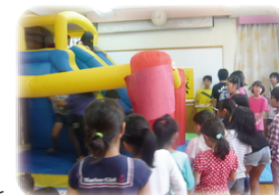
写真は前年度の様子です♪

※他にも、夏の間みんなが楽しく過ごせるように色々企画しています。たくさん遊びに来てくださいね!