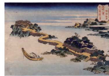
【琉球八景】臨海湖声(浦添市美術館所蔵)