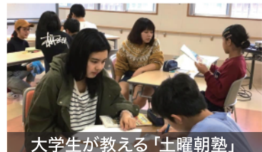
大学生が教える「土曜朝塾」