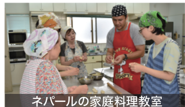
ネパールの家庭料理教室