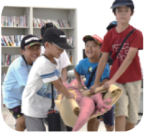
リッカ!ヤールキャラバン!では、「毛布で担架トライアル」のプログラムで体験