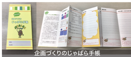
企画づくりのじゃばら手帳