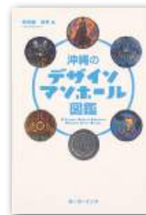
仲宗根 幸男 / 著 ポーダーインク

今回は、沖縄本島から離島の様々なデザインマンホール蓋を撮影した本の紹介です。一説によるとデザインマンホールは、那覇市が初めて昭和52年と言われているようです。現在は、各地で作成されていて、各地域の伝統芸能、スポーツ、特産品、名所など刻まれていて興味深い物です。那覇のシーサーや首里織をデザインしたカラーマンホールも素敵です。この本でお気に入りデザインを見つけてください。