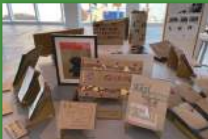
ダンボール部は、「未来の〇〇」というテーマで制作した絵本を展示しました。

2月5日~7日の3日間、ホテル アンテルーム 那覇にてアートな部活動の部活動の成果発表として展示会を開催、部員が手がけた作品とアーティストである顧問の作品を展示し、地域の方々や部員の家族だけでなく、ホテル利用のお客様など、幅広い層の来場客で賑わい3日間で200人以上の方にご来場いただきました。