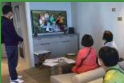
ユーチュー部は部員が撮影&編集した動画を上映。