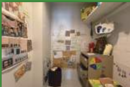
ポストポスト部は部室の展示。沢山のピークグッズ!2Fにはお手紙の体験コーナーも。

2月13日には顧問のオンライントークイベントも開催。それぞれの部活動の活動内容に加え、それぞれのアーティストとしての活動や問題意識についてもお話しいただき、各部活動の取り組みの意義をより深めることができました。