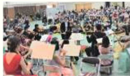
「琉球フィルハーモニックオーケストラ」の公式ホームページです。QRコードを読み取ってご覧ください。 https://ryukyuphil.org