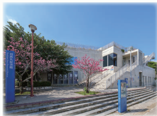
・・・船をイメージしてつくられた記念館・・・